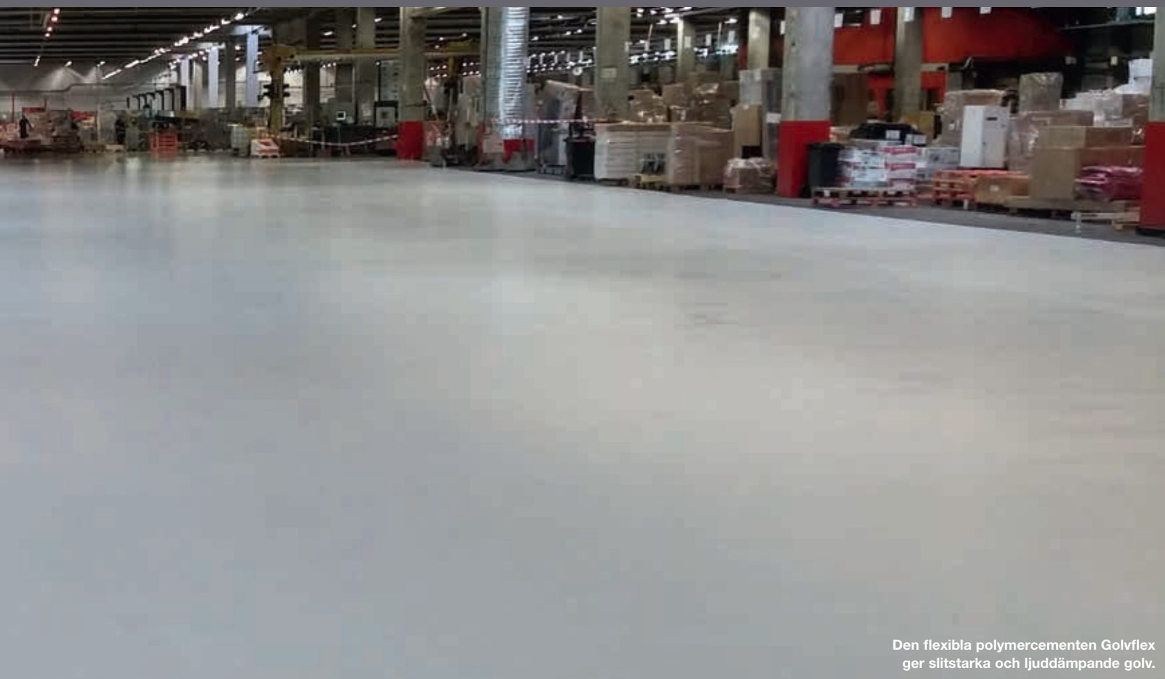
Den flexibla polymercementen Golvflex ger slitstarka och ljuddämpande golv.

produkten och förenar sig med den. Den blir mer portät helt enkelt och därmed mycket lättare att städa, säger Bengt-Arne Sandberg.