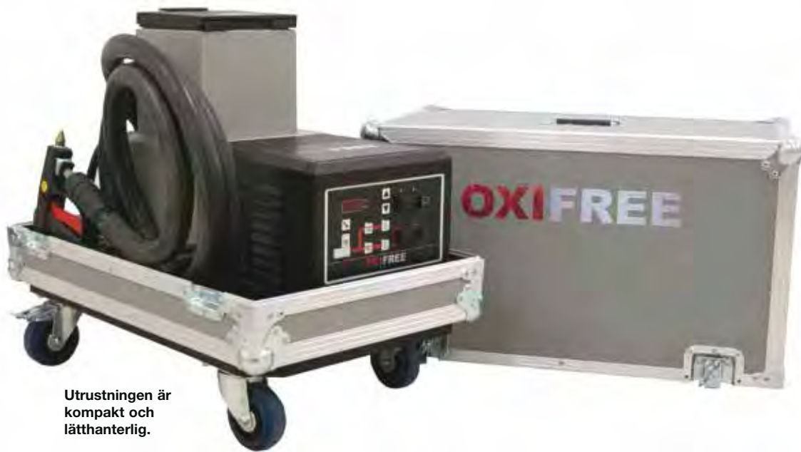
Utrustningen är kompakt och lätthanterlig.