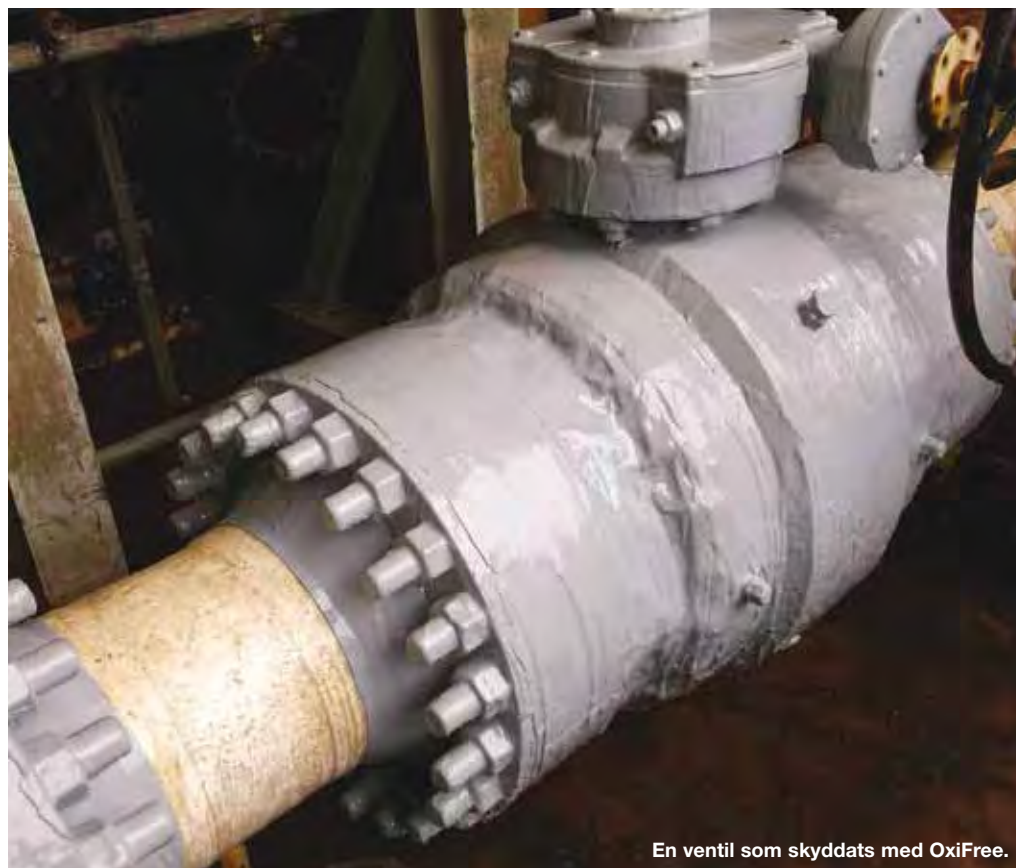
En ventil som skyddats med OxiFree.